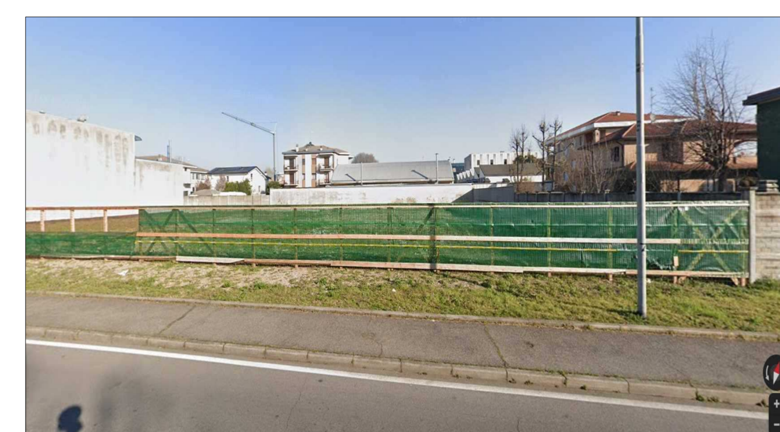
AREA NUOVO EDIFICIO PAGG ASPOCK