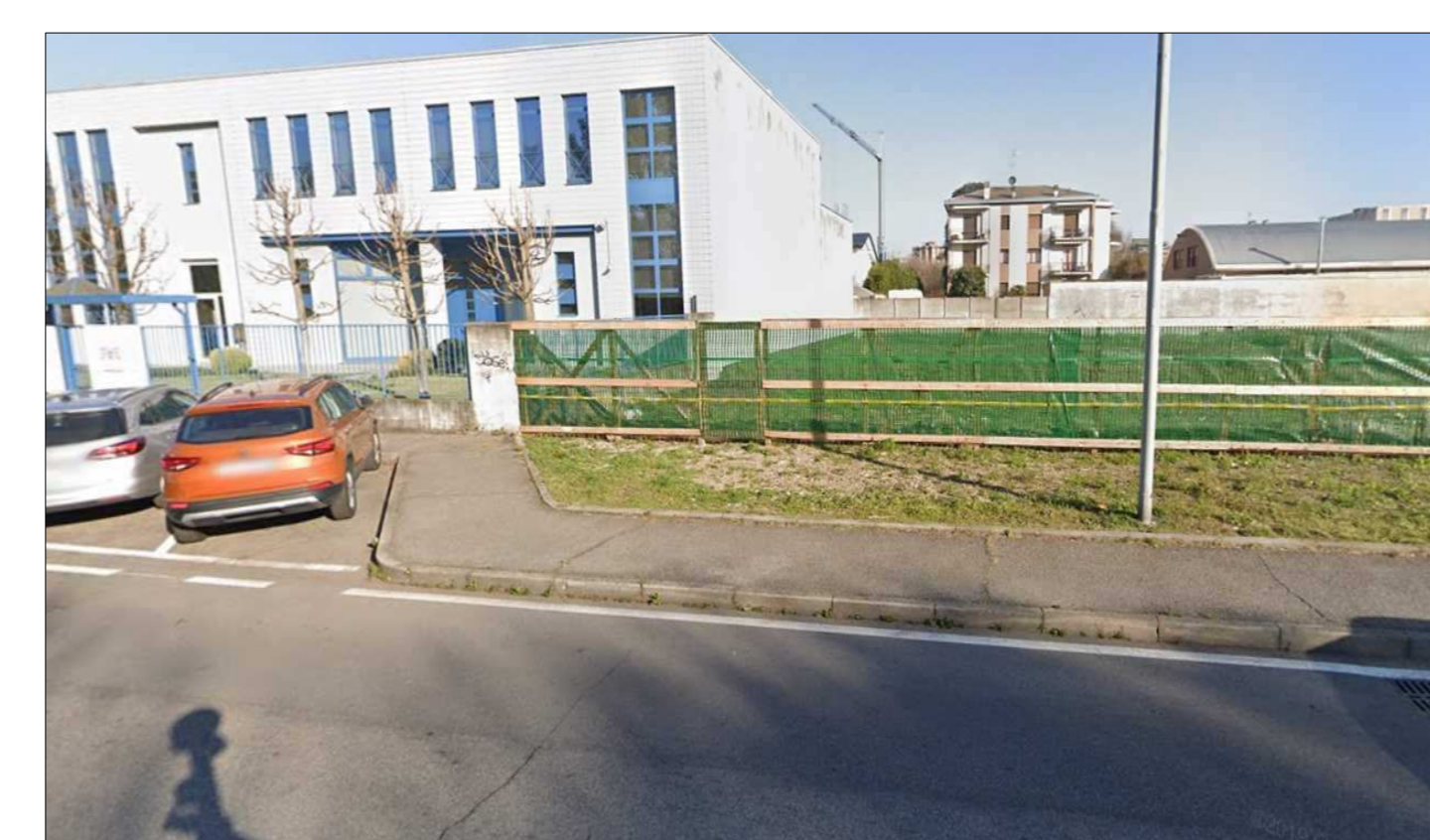
CONFINE EDIFICIO PAGG ASPOCK ESISTENTE